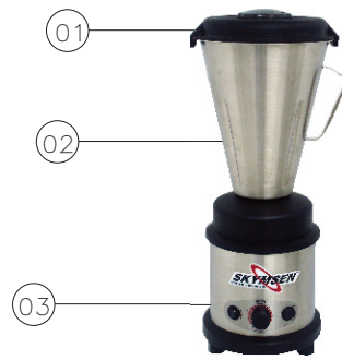
Figura - 03