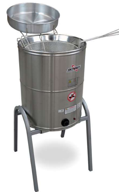
FRITADEIRA ELÉTRICA ÁGUA E ÓLEO, INOX