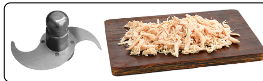
Cooked meat shredder blade (optional) Cuchilla deshiladora de carnes (opcional)