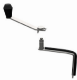
Scrapper Kit (optional) Kit rascador (opcional)