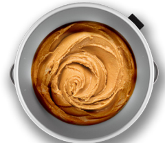
Prepares Peanut Butter Perfecto para hacer crema de mani