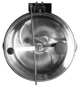
See-through lid Tapa de policarbonato